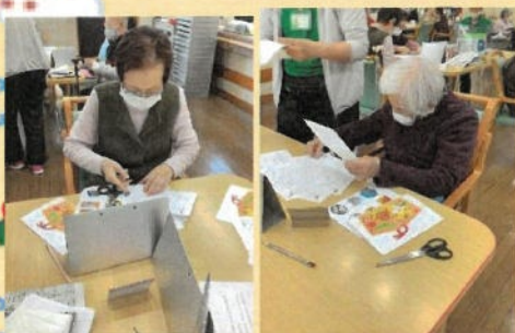
季節の制作 2022年カレンダー作り