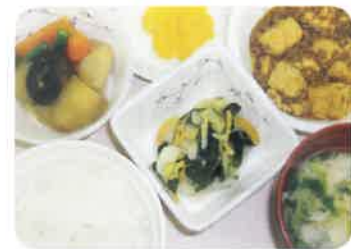
昼食の献立例（マールポ豆腐）