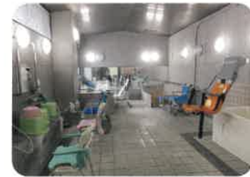
浴室全景（浴槽3ヶ所）